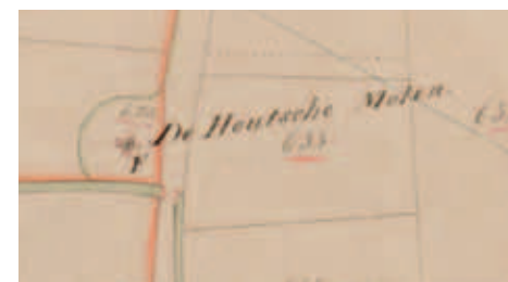
Op de kadastrale kaart uit 1832 werden de drie Helmondse banmolens ingetekend.