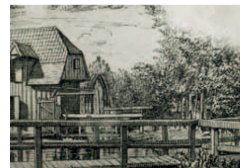
Het gemaal aan de Watermolenwal. Tekening van August Sassen gemaakt aan de hand van een foto uit 1861. (Collectie RHCE)