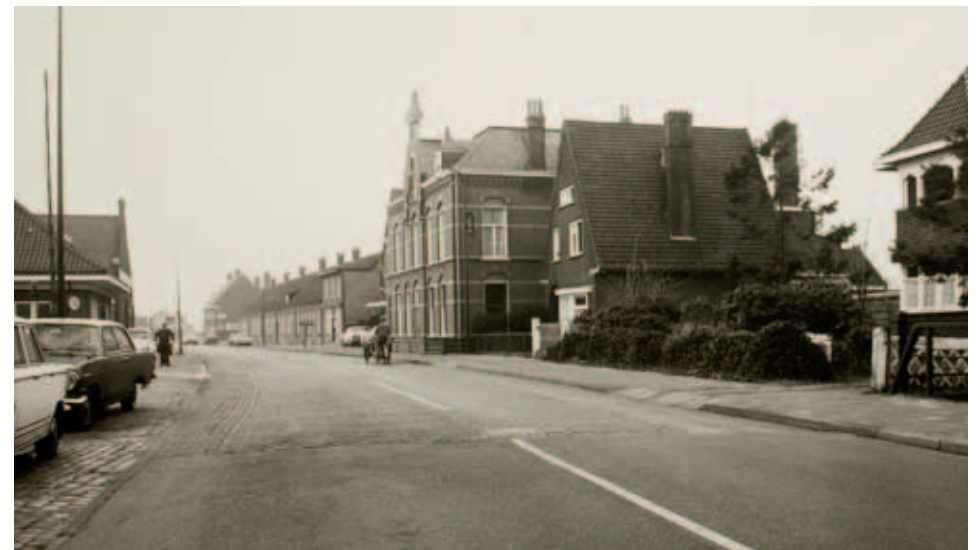
Mierloseweg ter hoogte van de Goorloop. Rechts van de weg (niet op de foto) stond de Houtse molen, dicht bij de Goorloop. Let op het wegdek: dat geeft precies de grens aan tussen Mierlo en Helmond.

Het voorschrift dat de molenaar verplichtte het meel tegen de vastgestelde prijs te verkopen, werd door de heer strijdig met de verordeningen genoemd. Het was volgens hem enkel welwillendheid