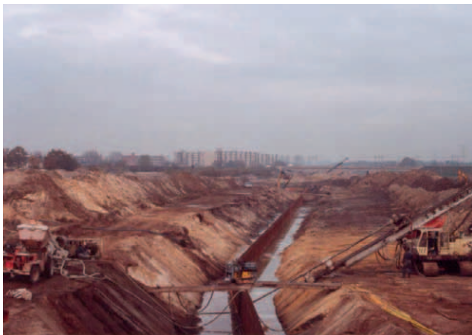
De speeltuin moest in 1974 wijken in verband met de omleiding van de Zuid-Willemsvaart. De aanleg daarvan liet nog een aantal jaren op zich wachten. Op de foto ziet u dat de werkzaamheden in volle gang zijn; het is dan inmiddels november 1989!