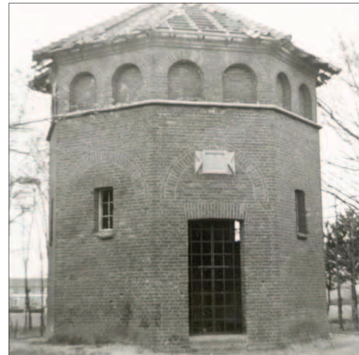
Het St. Jozefkappelletje stond in de Bakelse bossen tegenover de ingang van de speeltuin. Later werd het herbouwd in het Hortensiapark.