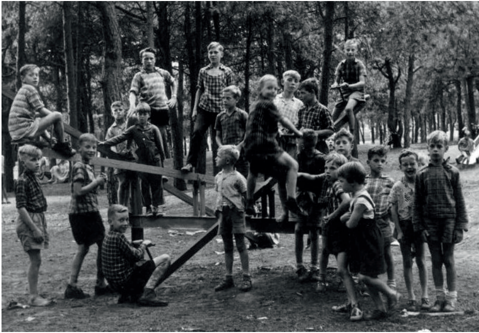
Het is een drukte van belang bij de wipplanken. Deze foto is genomen eind jaren vijftig

St. Jozefkapel en de Bakelsedijk. Voor de stadskinderen was het een heerlijke plek. De tuin was een bosperceel dat tegen de Bakelse bossen aan lag. Met geld dat door de parochianen bij elkaar was gebracht werd midden in het bos een groot H. Hartbeeld geplaatst 'opdat de kinderen ook voor en na 't spel zich hier zouden verzamelen en zelfs hun spel een hogere wijding geven' . Dit laatste stond in de feestgids die uitkwam bij het koperen jubileum van de St. Jozefparochie in 1936. Je bereikte de speeltuin via de Van Meelstraat, brug over de Nieuwe Aa en dan meteen links. Voorbij die ingang stond de dienstwoning van de beheerder van waaruit die toezicht had op de bezoekers. Op 3 januari 1934 werd de vergunning getekend voor een extra achteringang vanaf de Bakelsedijk. Je moest dan, na de brug over de Nieuwe Aa op die straat, rechtsaf over een heel