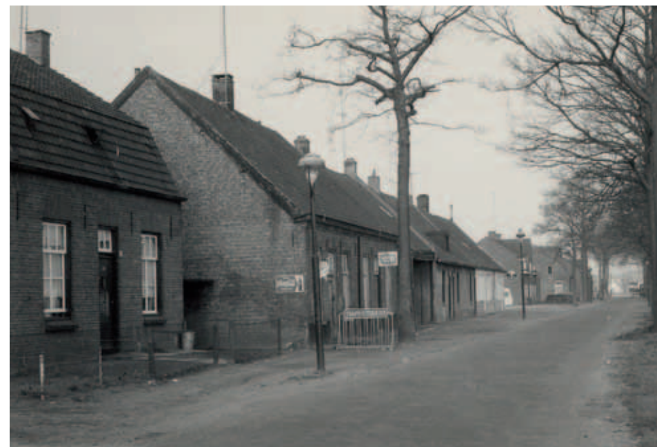
De Molenstraat werd met de aanleg van het spoor doormidden gedeeld. Het deel dat hier op de foto te zien is werd voortaan Rooseindsestraat genoemd. De foto is genomen vanaf het Nieuw Geremt in de richting van het spoor. Hier lag ook de Gemeyntse of Hoogeindsche molen aan de linkerkant van de weg.