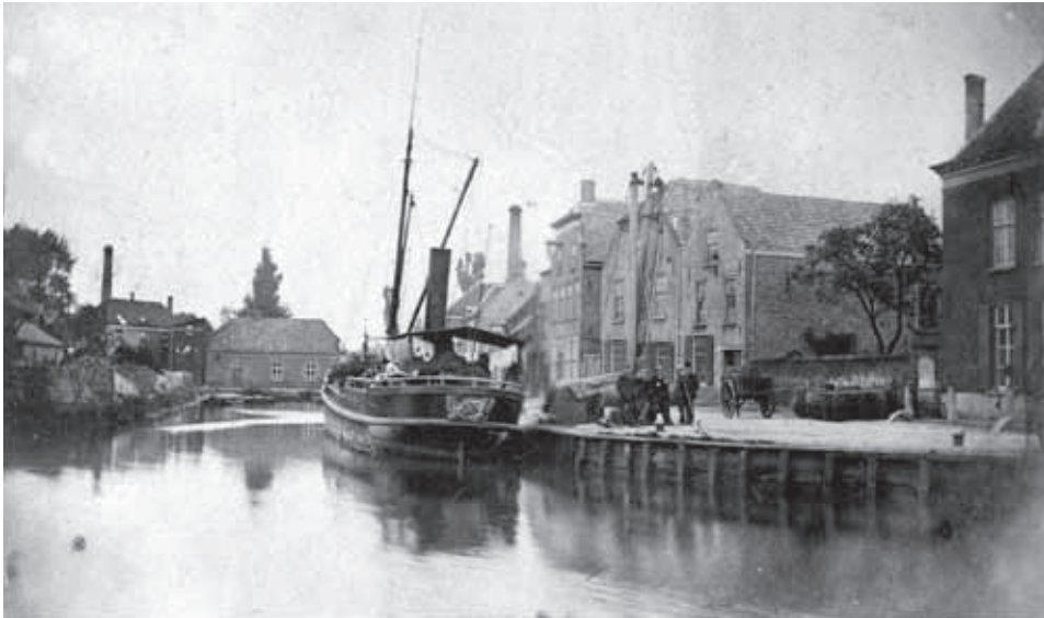
Opname van de eerste Helmondse haven, gemaakt kort voordat deze in 1884 gedempt werd. Tegenwoordig ligt hier het havenplein. Op de achtergrond, links van de stoomboot is de stoom- en watermolen te zien.

verplicht de dijken te onderhouden zodat die erven geen schade ondervonden. De pachtsom bedroeg 106 mud rogge, 5 mud tarwe, 20 mud mout en 4 mud boekweit, alles in Helmondse maat. Daarnaast was de pachter na oude gewoonte verplicht 'die gebackten' te leveren. Hij moest zoveel meel op het kasteel leveren als daar voor het bakken van brood nodig was. De leveringen mocht hij op de pachtsom korten, maar als hij een week oversloeg werd de pacht met één vat rogge verhoogd.